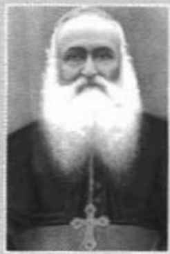
ഫ്രീഷപ്പ് പാൾസ് ലവീഞ്ഞൻ

ചെറുകര മാത്തുച്ചൻ (ലേഖകന്റെ വലിയ മാതൃലൻ) ഫ്രാൻസിസ്കൻ ക്ലാർ സമൂഹത്തിന്റെ തുടക്കം എട്ടു ഭക്ത സ്ത്രീകൾ - 1888 ഡിസം. 14