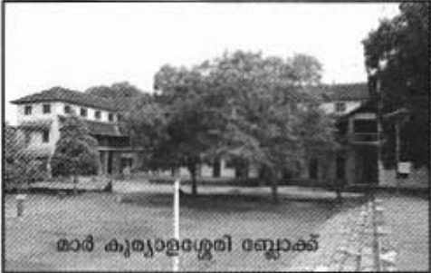
മാർ കുര്യാളശ്ശേരി ബ്ലോക്ക്

ആവിഷ്കാരമാണ്. രണ്ടു വർഷം മാത്രമേ, ദൈവനീതി പ്രാവർത്തികമാകാൻ (The shortest innings in the annals of the principals of St. Berchmans), ലേഖകൻ (1996-'98), നൗകയുടെ അമരത്തുണ്ടായിരുന്നള്ളൂ. താപസവര്യനായ വിലുചുനാണ് വല്ലഭുബിലിയുടെ ചുക്കാൻ പിടിക്കാൻ ഭാഗ്യമുണ്ടായത്. നിരവധി സ്മാരകങ്ങൾ സ്ഥാപിച്ച്, സർവ്വവ്യാപാരസമന്വൃതം, സുവർണ്ണബിലി നടത്താൻ, നല്ലവനായ ദൈവം നിയോഗിച്ചത്, സർവ്വകലാവല്ലഭനായ, കുര്യാളശ്ശേരിൽ കൂട്ടപ്പനച്ചനെയാണ്. ഈ മഹാമന്യാരുടെ പിന്തുണയോടെ, കലാലയമുത്തെയുടെ പ്ലാറ്റിനം ബിലി ആഘോഷിക്കാൻ അവിശ്വസ്യ അനുവദിച്ചത് 'വട്ടക്കളത്തിൽ കൂട്ടപ്പ' നെയാണ്. വെറും പുഴുമാണെങ്കിലും, 'വട്ടക്കളം', പുഴുത്തിനു മുമ്പ് 175 വലിയവർ, അധ്യാപകശ്രേഷ്ഠർ, 91 അനധ്യാപക സഹോദരങ്ങൾ ഉണ്ടായിരുന്നതുകൊണ്ടു കർത്താവിനു മഹത്തമമുണ്ടായി. കാണപ്പെടുന്ന സ്മാരകം എന്നു പറയാൻ പ്രൊഫ. ഉലഹന്നാൻ മാപ്പിള സെന്റ് ഹോൾ ഓറിയന്റൽ സ്റ്റുഡീസ്, സെന്റ് ബർക്കമാൻസ് ബെസ്റ്റ് ടീച്ചർ അവാർഡ് ഇവ മാത്രമേ ഉള്ളൂ.